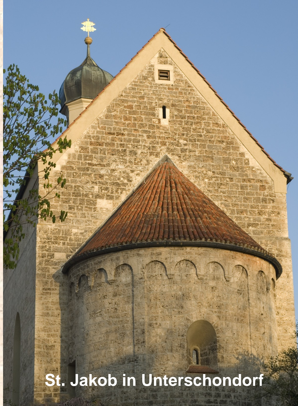
St. Jakob in Unterschondorf