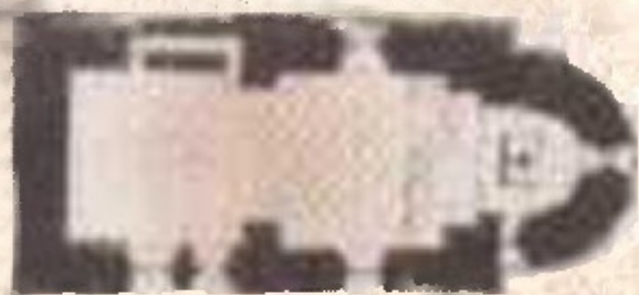
Aufmasszeichnung des Revlerförsters F. X. Rehbock 1849