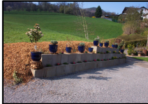
Frühling im HAUS CHRISTA